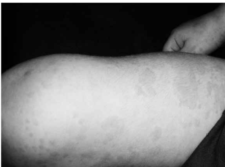
Figura 1: rash eritematoso sobre muslo de paciente masculino de 4 años de edad con AIJS de reciente comienzo. Obsérvese la presencia de lesiones de diferente diámetro, algunas de ellas coalescentes.

Cerca del 80 % de los pacientes muestran rash cutáneo al debut. Es habitualmente color salmón o eritematoso, morbiliforme, y cada lesión está rodeada de una zona pálida; las lesiones purpúricas no ocurren y el prurito puede ocurrir en un 5 % de los pacientes (7). Su característica más distintiva es su evanescencia; puede coincidir con los momentos de fiebre y ser migratorio. El diámetro de cada lesión individual varía entre 2 y 10 mm (7). El rash es más común en el tronco y las regiones proximales de las extremidades. El estudio patológico usualmente demuestra infiltrados de neutrófilos y monocitos subdérmicos, perivascularmente junto con una mayor expresión de moléculas de adhesión. Los queratinocitos están activados y expresan MRP 8 y MRP 14 (83). Figura 1.